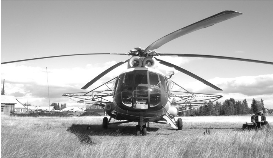
Рис. 1. Система EM-4H на борту вертолета Ми-8

Измерение параметров переменного магнитного поля осуществляется приемными рамками, расположенными в гондole, буксируемой на тросе длиной 70 метров. Приемник имеет каналы измерений по трем ортогональным осям. Его чувствительность на рабочих частотах составляет десятые, и даже сотые доли мкА/м.